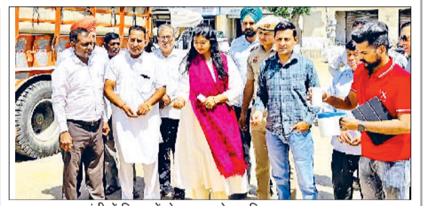
बराड़ा। अनाज मंडी में किसानों से बात करते हुए विधायक।