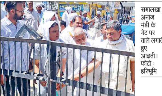
समालखा। अनाज मंडी के गेट पर ताले लगाते हुए आढ़ती।

समालखा की नई अनाज मंडी में बुधवार को आढ़तियों ने अपनी मांगों को लेकर मंडी के दोनों गेटों पर ताला लगा दिया। इस दौरान उन्होंने सरकार के खिलाफ नारेबाजी भी की। मंडी गेट बंद होने से बाहर ट्रैक्टर-ट्रालियों की लंबी कतारें लग गईं। वहीं, आढ़ती एसोसिएशन के जिला प्रधान धर्मवीर मलिक ने बताया कि, फसल का उठान न होने, बारदाने की कमी और गेहूं खरीद प्रक्रिया ठप होने के कारण आढ़ती परेशान हैं। मंडी के एंट्री गेट बंद होने