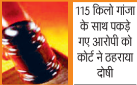
115 किलो गांजा के साथ पकड़े गए आरोपी को कोर्ट ने उहाराया दोषी