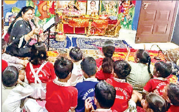
रादौर। मून स्टार प्री स्कूल में कार्यक्रम में भाग लेते बच्चे व स्टाफ सदस्य।