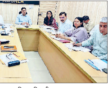
अंबाला। वीसी के दौरान मौजूद प्रशासनिक अधिकारी।