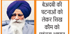
बेअदबी की घटनाओं को लेकर सिख कौम को पहुंचता आघात