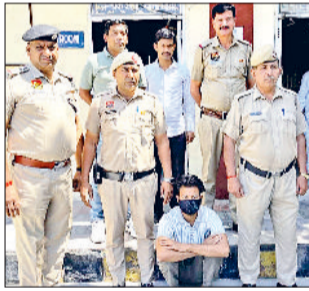
यमुनानगर। गांधी नगर पुलिस टीम द्वारा पकड़ा गया दुष्कर्म का आरोपी युवक।