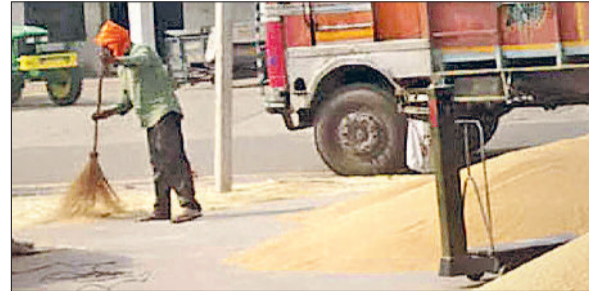
यमुनानगर। अनाज मंडी में बिकने को पहुंची गेहूं की लगी ढेर।

उपायुक्त प्रीति ने बताया कि जिला की सभी अनाज मंडियों में