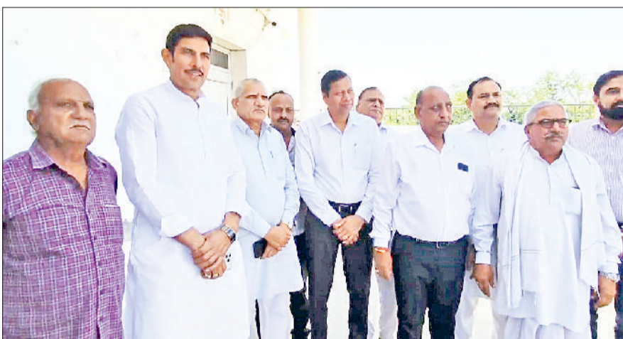
कुरुक्षेत्र। बैठक के बाद जानकारी देते आढ़ती।