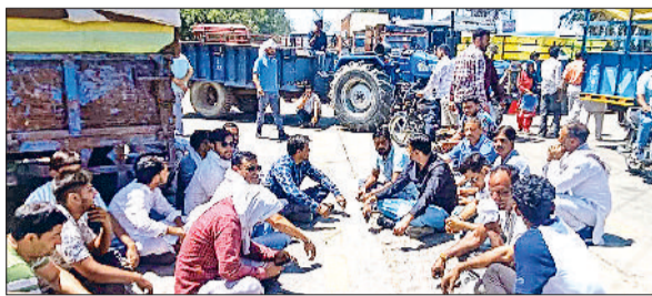
रादौर। गेट पास न काटे जाने पर जाम लगाते किसान।

जिला की मंडियों में गेहूं की आवक आए दिन बढ़ती जा रही है। इसी को लेकर मंडियों में किसानों को भी आए दिन किसी न किसी मुसीबत से हाथ मिलाना पड़ रहा है। कहीं किसान गेहूं में नमी को लेकर परेशान है, तो कहीं पानी की समस्या तो कहीं शौचालय की समस्या को लेकर। बुधवार को कस्बा रादौर की अनाज में गेट पास पोर्टल बंद पड़ा रहा। जिसको लेकर किसानों में रोष दिखा। किसानों ने एसके रोड पर ट्रैक्टर-ट्रालियां खड़ी कर जाम लगा दिया और नारेबाजी कर अपना रोष प्रकट किया। लगभग 1 घंटा लगे जाम से सड़क के दोनों ओर वाहनों की लंबी लंबी लाइनें लगी गईं। वाहन चालक अपने गणतंत्र्य तक पहुंचने के लिए आसपास के लिंक रोड का रुख करने लगे। मौके पर मौजूद संदीप टोपरा ने बताया कि प्रशासन ने बिना तैयारी किए ऑनलाइन