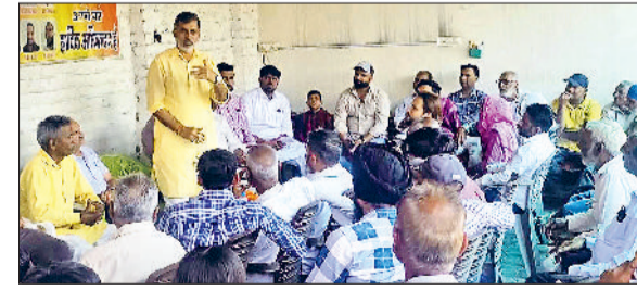
यमुनानगर। दुधली में जनसंपर्क के दौरान ग्रामीणों को सरकार की योजनाओं की जानकारी देते पार्टी के वरिष्ठ नेता नेपाल राणा।

भाजपा द्वारा जिला में चलाए जा रहे गांव चलो बस्ती चलो अभियान के तहत पार्टी कार्यकर्ताओं ने रादौर विधानसभा क्षेत्र में जनसंपर्क किया। इस दौरान अभियान का नेतृत्व कृषि मंत्री श्याम सिंह राणा के बेटे एवं भाजपा के वरिष्ठ नेता नेपाल राणा ने किया। उन्होंने ग्रामीणों को केंद्र व प्रदेश सरकार की योजनाओं से अवगत करवाया। भाजपा नेता नेपाल सिंह राणा के नेतृत्व में पार्टी कार्यकर्ताओं ने अभियान के तहत दुधली, रेतगढ़, टोपरा खुर्द, मण्डेबरी, मण्डेबरी, सुदेल, खेडी रांगडान, अमरपुर व ससौली आदि में जाकर ग्रामीणों से